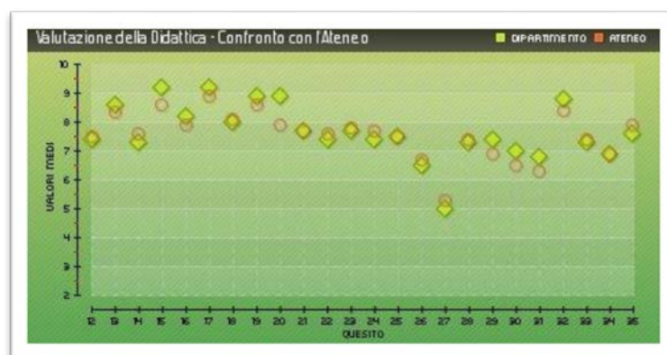
Graf. 2 – Grafico a punti generato dal sistema

Il grafico a punti riporta i punteggi medi di ciascun quesito; tali punteggi sono messi a confronto con i punteggi medi delle valutazioni del livello gerarchico superiore (Dipartimento con Ateneo, Corso di Studio con Dipartimento, Singolo insegnamento con Corso di Studio).